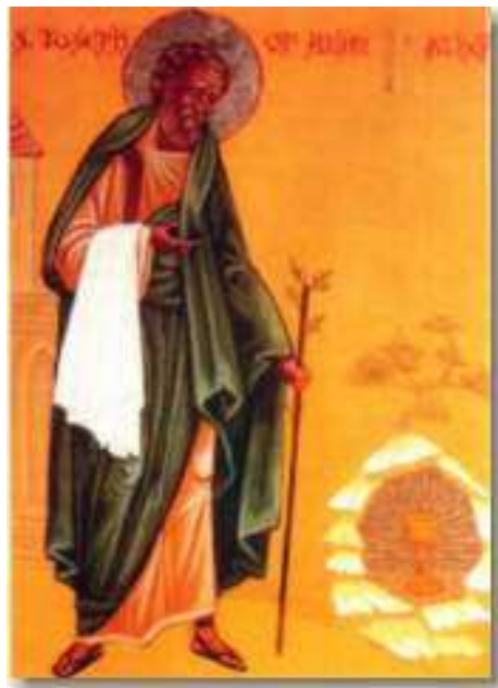
Giuseppe di Arimatea